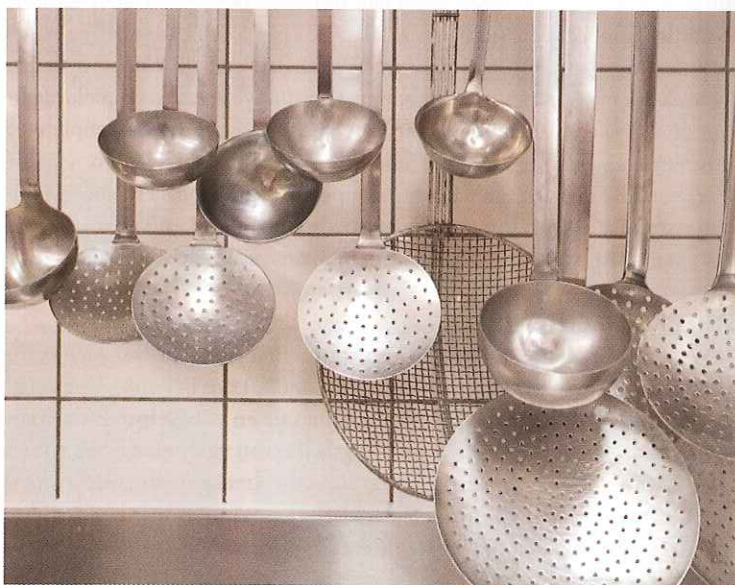
Koks houden zich bezig met de bereiding van verse gerechten.

Oorspronkelijk richtte die vestiging zich op pluimveehouderij, varkenshouderij en rundveehouderij. Intussen is de doelstelling veel breder geworden. De praktijktrainingen zijn onderverdeeld in drie gebieden: dierhouderij (huisdieren), veehouderij en activiteiten in het buitengebied.