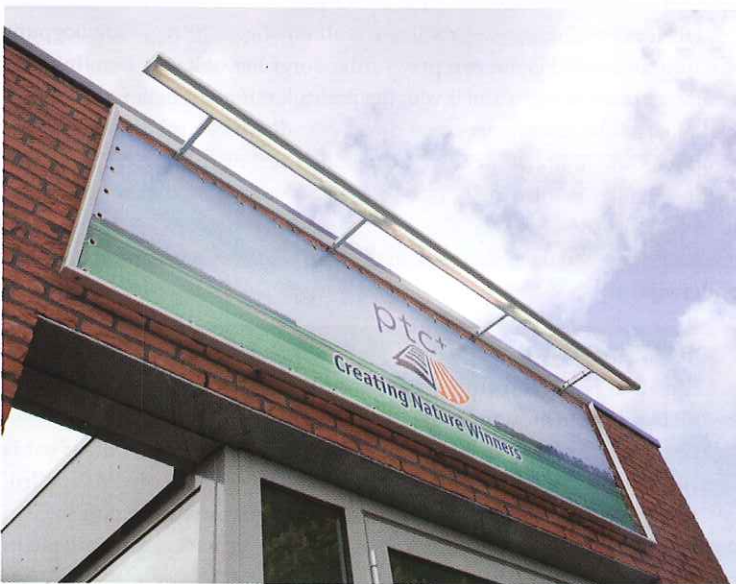
PTC+ vervult een voortrekkersrol op het gebied van streekproducten.

En de kwaliteit van de voeding is toegenomen, meldt het drietal. Neem ijsbergsla. Afkomstig uit de regio en dus vers. Wijnands: 'Toen we de ijsbergsla en andere groenten van de reguliere groothandel afnamen, kwamen die vaak van heel ver, misschien wel uit landen als Argentinië, Spanje of Bulgarije. Die producten zijn dagen onderweg voordat ze op de plaats van bestemming arriveren. Wat ons betreft, is dat voltooid verleden tijd.' ■